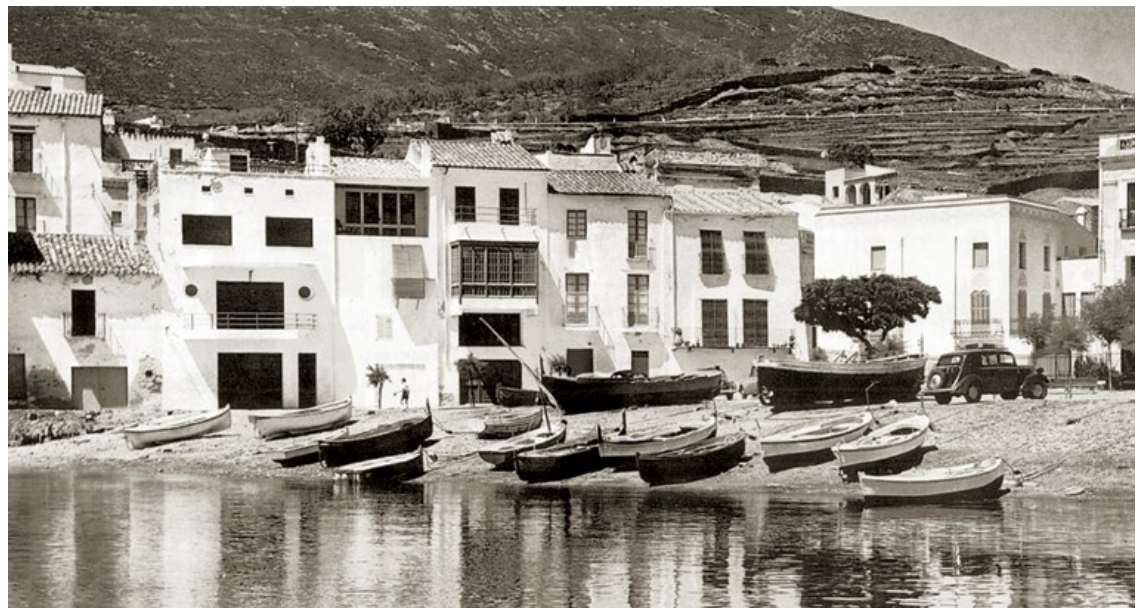
Casa Villavecchia en Cadaqués, Gerona (1955)

The Barcelona of the annus mirabilis 1992 had Correa and Milà among its protagonists. Their practice – after winning with Margarit and Buxadé the competition for the Olympic Ring, where buildings like Isozaki's Palau would go up – collaborated with the Italian Vittorio Gregotti in renovating the Olympic Stadium, venue of the most significant events of the Games. It was not Olympic Barcelona, however, but inner Catalonia, that would harbor Correa's last major work, the Episcopal Museum of Vic, home to a splendid collection of Romanesque art, where the architect combined medieval and modern in the free arrangement of windows, as he had done in the Villavecchia House in Cadaqués, somehow returning to where he started and closing the circle of a career that has orbited around the city he helped make and which made him, Barcelona.