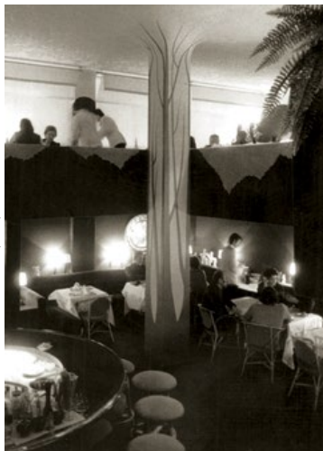
Restaurante Il Giardineto, Barcelona (1974)

La Barcelona del annus mirabilis de 1992 tuvo a Correa y Milà entre sus protagonistas, ya que el despacho, tras ganar con Margarit y Buxadé el concurso del Anillo olímpico, donde se ubicarían obras como el Palau de Isozaki, colaboró con el italiano Vittorio Gregotti en la remodelación del Estadio Olímpico, sede de los eventos más significativos de los Juegos. Pero no sería la Barcelona olímpica sino la Cataluña profunda el escenario de la última obra importante de Correa, el Museo Episcopal de Vic, que alberga una extraordinaria colección de arte románico, y que el arquitecto realizó hermanando medievalismo y modernidad en la libre disposición de los huecos que hace la fachada autónoma, como ya había ensayado en la Casa Villavecchia de Cadaqués, en cierta forma retornando al origen y cerrando circularmente una carrera redonda que orbita en torno a la ciudad que ha hecho y que le ha hecho, Barcelona.