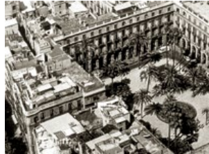
Ordenación de la Plaza Real, Barcelona (1984)

Desde interiores de tiendas y restaurantes hasta planes urbanos como el Anillo Olímpico o la ordenación de la Plaza Real, la obra de Correa ha cubierto todas las escalas, integrándose en el entorno como en sus casas de Cadaqués.