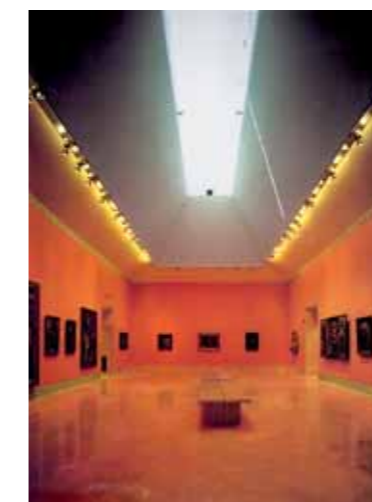
© Michael Moran Thyssen-Bornemisza Museum, Madrid (1989-92)