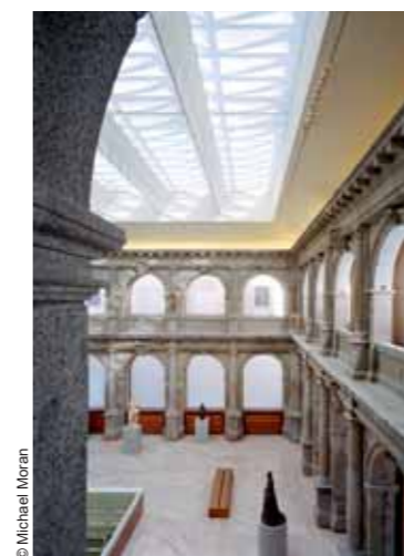
Prado Museum extension, Madrid (1996-07)