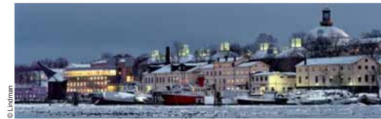
Museos de Arte Moderno y Arquitectura Modern Art and Architecture Museums, Stockholm (1991-98)

dos; no menor trascendencia tendría la ampliación del Museo del Prado, iniciada en la misma fecha, y que vendría a completar una extraordinaria secuencia de intervenciones a lo largo del eje Prado-Castellana, de la sede de Bankinter a la estación de Atocha, e incluyendo el Museo Thyssen y la ampliación del Banco de España —un proyecto de admirable subordinación a lo existente, ganado en concurso en 1978 y completado sólo en 2006—, para mostrar que el Moneo de los éxitos internacionales, del Zoco de Beirut a la Universidad de Columbia, podía también ser profeta en su tierra; y especial significado cabe también atribuir a la parroquia Iesu en San Sebastián, un espacio lírico construido con luz y financiado con el supermercado que se aloja bajo él, reuniendo como en Los Ángeles lo sagrado y lo profano, y que cierra este itinerario en la misma ciudad donde se inició. Rafael Moneo recibió la noticia de la concesión del Premio Príncipe de Asturias de las Artes —que había antes distinguido a su mentor Sáenz de Oiza— el mismo día que cumplió 75 años, y esta última coincidencia es un buen colofón provisional para una carrera de extraordinaria brillantez profesional e intelectual, seguramente la más destacada del último medio siglo español.