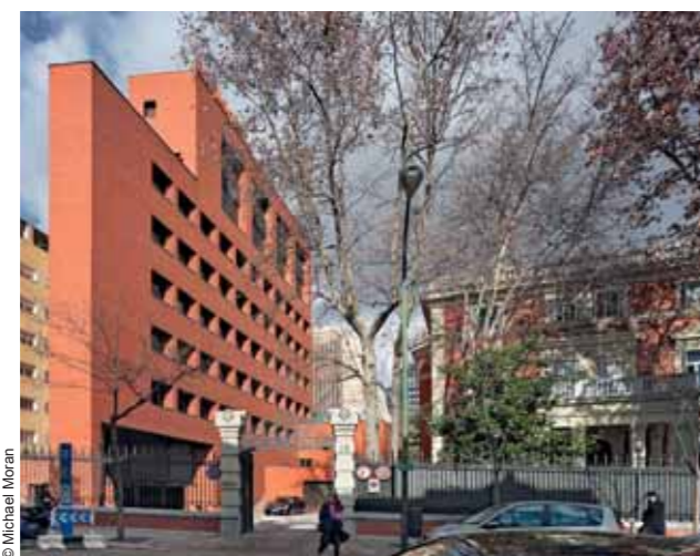
Sede de Bankinter Bankinter headquarters, Madrid (1972-76)