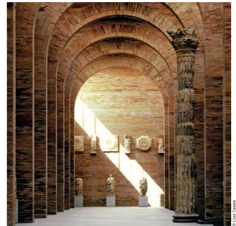
National Museum of Roman Art, Mérida (1980-86)