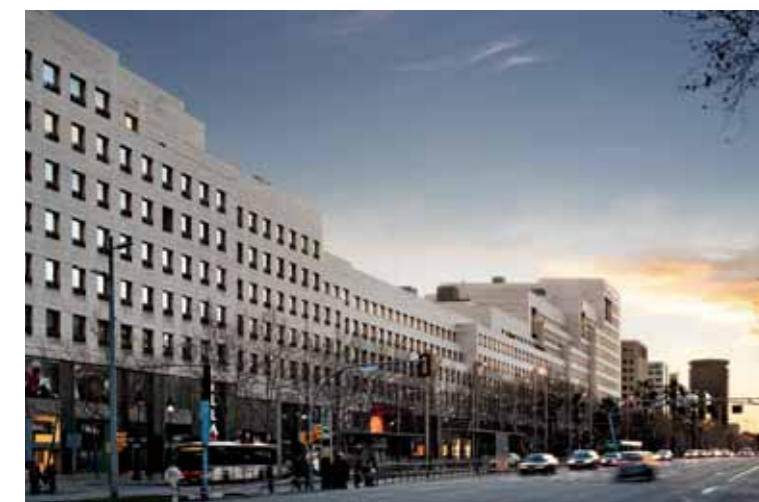
Edificio L'Illa Diagonal L'Illa Diagonal building, Barcelona (1987-93)

successes, from the Beirut Souks to Columbia University, could also be a prophet in his own land; and a special meaning can also be seen in the Iesu parish church in San Sebastián, a lyrical space built with light and financed by the supermarket housed under it, uniting the sacred with the profane as in Los Angeles, and which wraps up this itinerary in the city where it began. Rafael Moneo received the news of his winning the Prince of Asturias Award for the Arts the day he turned 75, and this latest coincidence is a good provisional finale for an extraordinarily brilliant professional and intellectual career, surely the most outstanding of the last Spanish half-century.