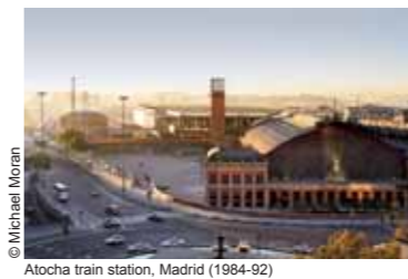
Atocha train station, Madrid (1984-92)