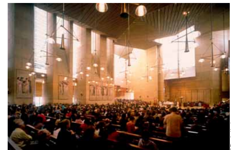
© Timothy Hursley Catedral de Nuestra Señora Our Lady of the Angels Cathedral, Los Angeles (1996-02)