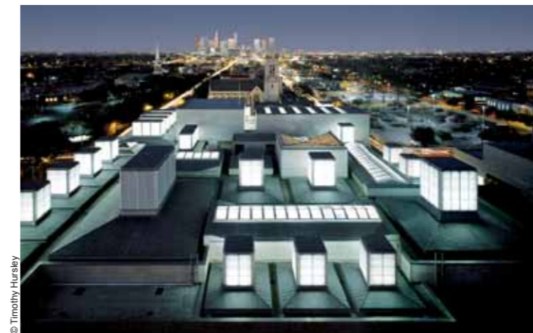
© Timothy Hursley Museum of Fine Arts, Houston (1992-20)

Houston – his first American works, two cubes topped with skylights at the service of art –, but in 1990–91 he executed three buildings in Europe which masterfully expressed the tension between respect and rupture when constructing in geographical or urban landscapes: the Kursaal of San Sebastián is an auditorium and convention center that can be described through the metaphor provided by the architect himself, two rocks stuck on the beach with a crystalline geometry belonging more to the accidental coast than to the grid of the regular city; the Moderna Museet and Arkitekturmuseet of Stockholm blend into the horizontal landscape and