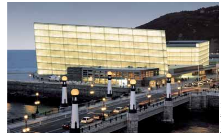
© Anxón Hernández Kursaal auditorium, San Sebastián (1990-99)

exceptional social and symbolic importance which Moneo executed by combining the visibility from the freeway at its feet with liturgical innovations inside, reconciling automobile culture with sacred spaces; no less far-reaching would be the enlargement of the Prado Museum, initiated at the same time, which would complete an extraordinary sequence of works along the Prado-Castellana axis, from Bankinter to Atocha and including the Thyssen Museum and the extension of the Bank of Spain – a project designed in 1978 but completed only in 2006 that shows admirable subordination to the original building, –, to show that the Moneo of international