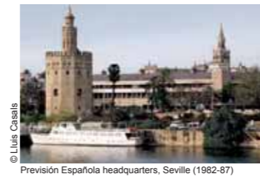
Previsión Española headquarters, Seville (1982-87)

pero durante la primera mitad de los ochenta desarrolla también otros dos proyectos que obligan a revisar las relaciones entre historia, continuidad y carácter: la sede de Previsión Española en Sevilla y la Estación de Atocha en Madrid. Mérida es sin duda una obra feliz, donde el difícil desafío de construir sobre unos valiosos restos arqueológicos se resuelve con inesperada naturalidad, y donde la evocación de la imponente escala de la arquitectura romana se aborda con la regularidad rítmica y los ascéticos detalles de un galpón industrial refinado y rotundo, culto y popular a la vez; la Previsión sevillana, junto al Guadalquivir y la Torre del Oro, se inserta en la veduta romántica de la ciudad con sensibilidad pintoresca y materiales exquisitos, respetando el carácter del lugar para levantar un edificio más palaciego que financiero, y más intemporal que historicista; y Atocha, por último, amplía la marquesina de la vieja estación con un colosal espacio hipóstilo, creando además una nueva plaza flanqueada por la nave, un campanile de sabor nórdico y un volumen cilíndrico delimitado por robustos pilares cerámicos. Cuando todas estas obras están en construcción, Moneo —que ya había enseñado en Estados Unidos en 1976-77 y 1982— recibe una oferta que no puede rechazar: desempeñar