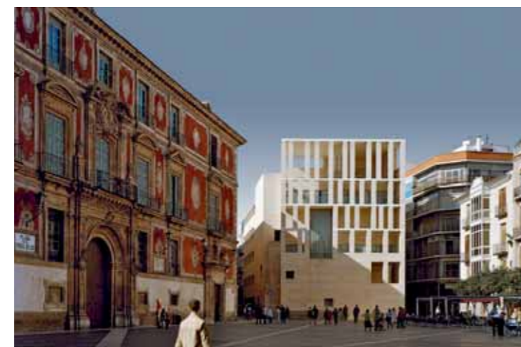
Ampliación del Ayuntamiento de Murcia City Hall extension, Murcia (1991-98)